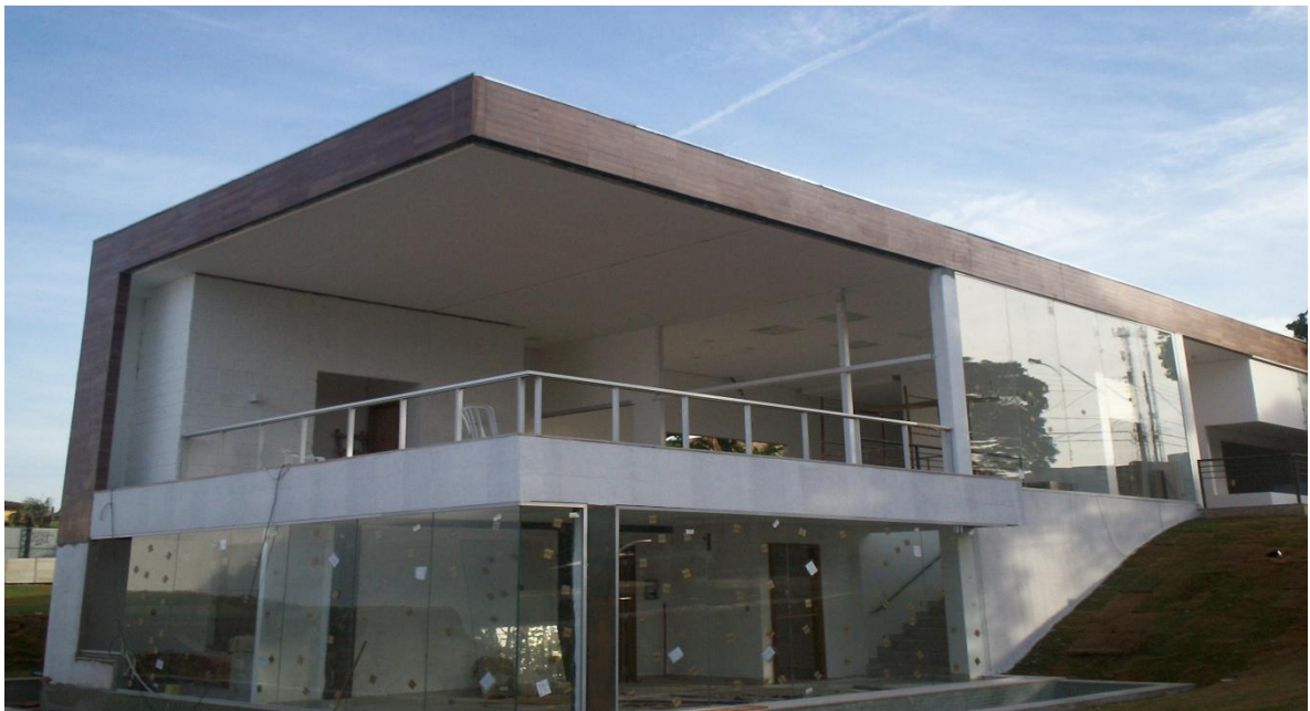
Foto geral do stand de vendas já com o porcelanato na fachada.