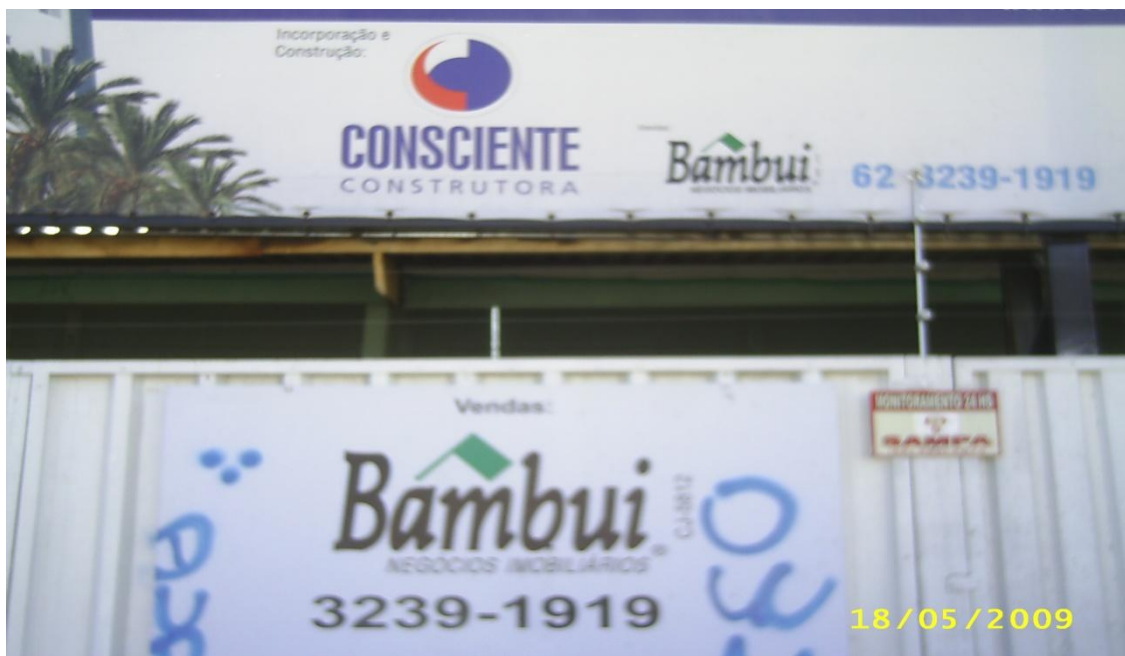
Fotos tiradas do canteiro de obra.