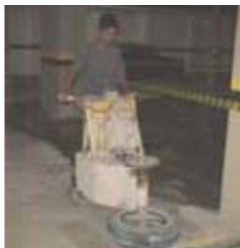
Acabamento com a Politriz

2- A superfície foi mantida sob lâmina d'água por um período mínimo de 6 horas para saturação dos poros;