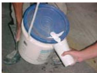
Preparação da Argamassa polimérica com Rheomix 104

3- Depois de respeitado este período, foi removido o excesso de água e aplicada a argamassa polimérica na proporção de 1 : 1.75 Rheomix 104 : Cimento Portland para estucamento e colmatção dos poros, consumo de Rheomix 104/m 2 nesta situação, aproximadamente 0,300 litro/m 2 ;