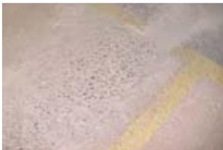
Superfície a ser recuperada

1- A preparação da superfície do piso foi realizada através de processo mecânico com auxílio de Politriz / abrasivo G. 60 para regularizar a superfície;