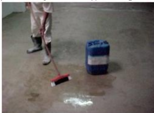
Aplicação de Endurecedor de Superfície Kure-N-Harden

5- Efetuada a cura, aplicou-se o Endurecedor de Superfície Kure-N-Harden utilizando-se vassoura de cerdas macias, esfregando por 30 minutos até formação de gel, diluição com água e uma nova aplicação por mais 15 minutos. O consumo foi de 0,200 litros/ m 2 e aguardou-se 24 horas para liberação da área p/ o tráfego de veículos.